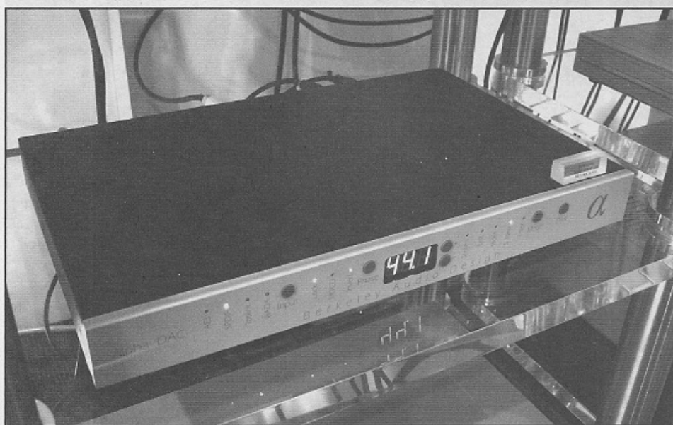
今次試聽的訊源來自這套 47 LAB +BERKEREY Alpha。

型號的特色，亦以 Mini 與 Ultimate 的設計作為理念，例如現役的 M5、V3 和 V2，它們都是採用與 Mini 相同的層疊式樺木配以鋁金屬去構成音箱，至於 Q 系列，這包括 Q1、Q3 和 Q5，它們的音箱則採用 Ultimate 的「全鋁打」製造，而大家面前這款 Q3，