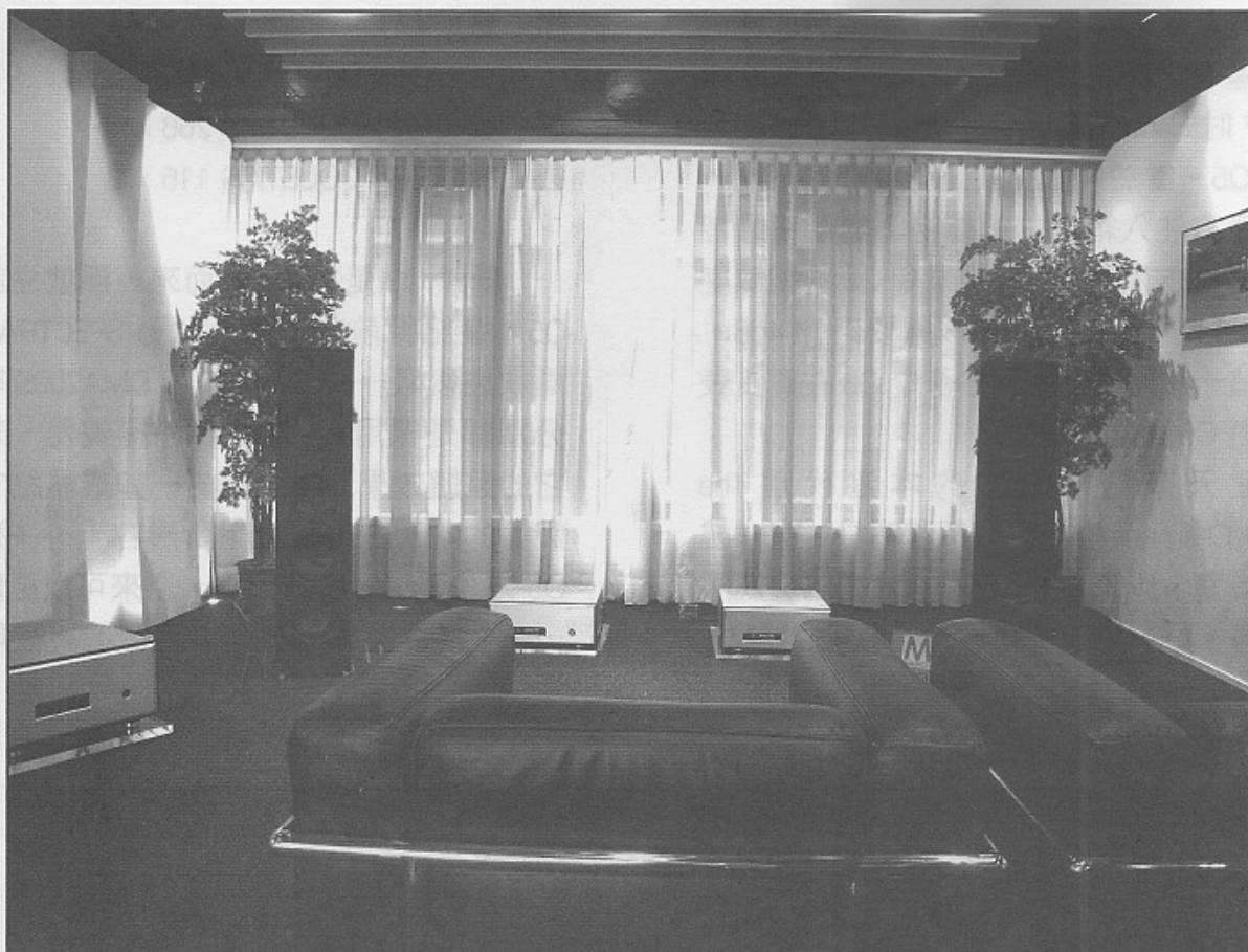
一對 FM 115，掂晒！