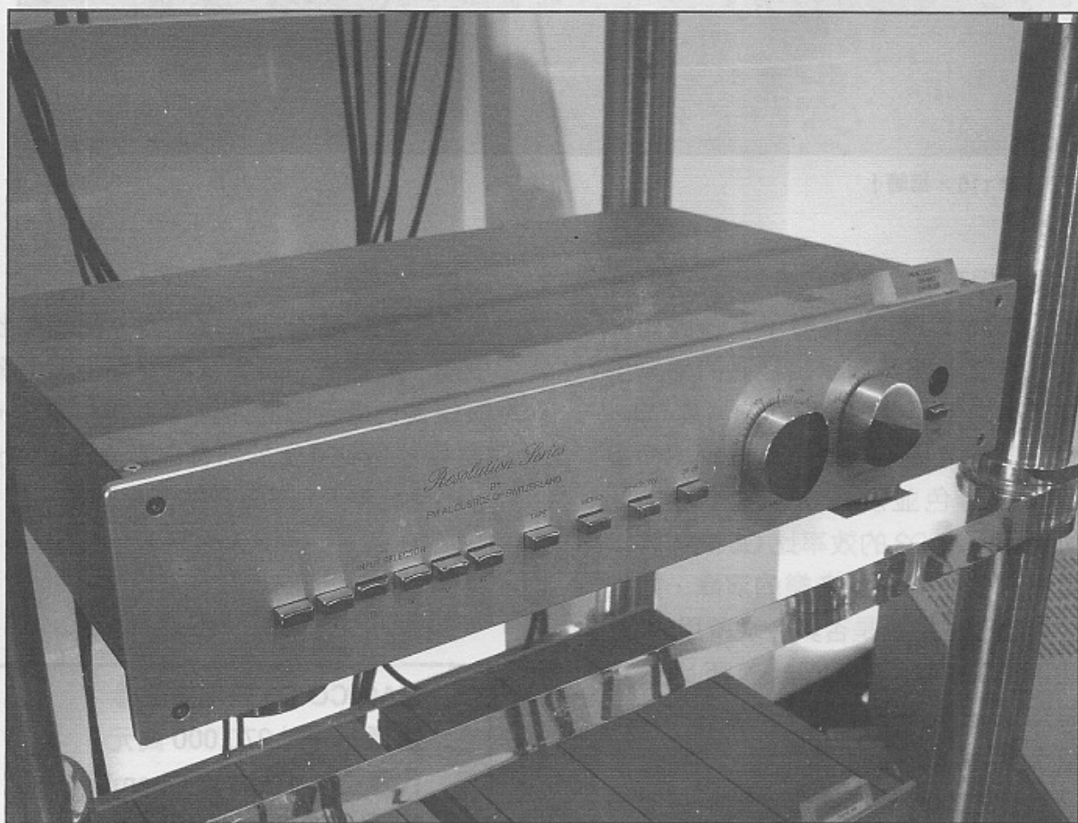
FM ACOUSTICS 266 MK II 前級。

既然 Q3 是本著 Q5 而來，那就先說說 Q5。還記得前陣子到此試聽 SPECTRAL 的兩款純後級——DMA260 和 DMA200S 時，分別都是採用 Q5 作為參考揚聲器，若從它的整體效果而言，真的一如最早給它寫評論的本刊主筆揚金耀所形容「……透過 Q5 方才發現，所謂天碟，原來可以更靚聲……」（詳見本刊去年 8 月號），證明此