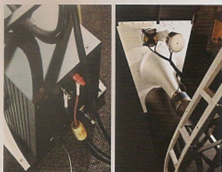
從這個角度看，最能了解 Ultimate II 的接線方法及結構。