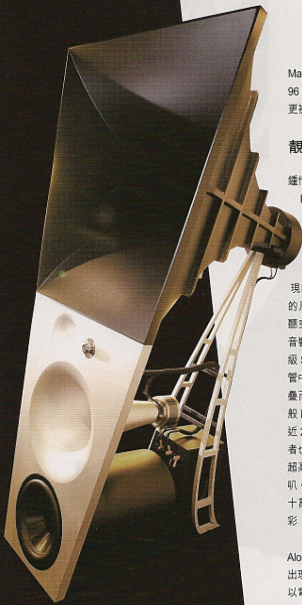
作為 Magico 的旗艦喇叭，Ultimate II 的造型絕對夠嚇頭吧！後方的支撐架線條尤其優美。

在高級音響範疇裡，來自美國三藩市的 Magico 不算歷史悠久，但自創辦人 Alon Wolf 於 96 年創辦該品牌以來，旗下作品每一鳴驚人，更被一眾發燒友公認為夢寐以求的珍品。