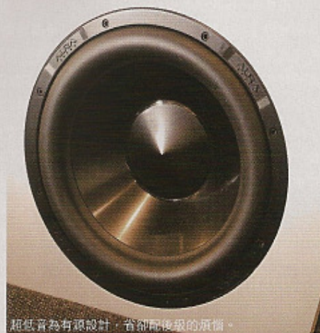
超低音為有銀設計，省卻配後級的煩惱。

有別於一般牌子，Magico 的喇叭並沒有固定的設計及選料，Mini II、V2、V3、M5 都是木製聲箱為主，但 Model 6 (身價已過百萬!) 卻採用全鋁合金聲箱；目的其實很簡單，就是一切只為靚聲而造，怎樣的設計需要用怎樣的材料才可發揮到十成功力？在大師 Alon Wolf 心目中，總有一套理論的。