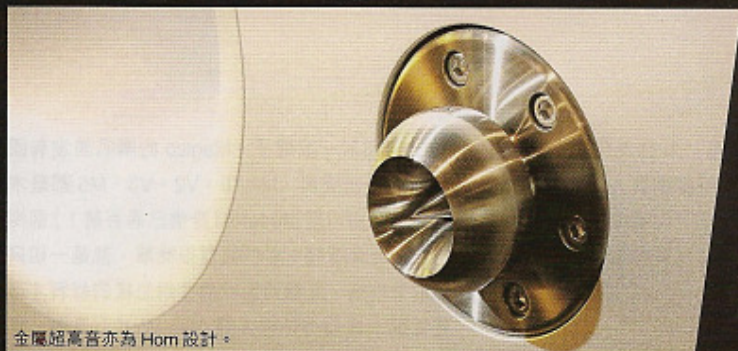
金屬超高音亦為 Horn 設計。

甫進入 Sound Chamber 的陳列室大房，第一眼看到 Ultimate II 的真身，真的被嚇了一大跳。從外型論，絕對可以用震撼驚愕來形容 Ultimate II；首先是高度，足有 2.28 米（大約 7 呎半），很多所謂的巨型喇叭「拍埋去」都即時變成小矮人；其次是設計，Ultimate II 並不存過往任何 Magico 喇叭的影字，一反傳統聲箱及單元布局，呈倒梯形上闊下窄的特殊中空外觀，共分成可拆式上下兩層，並以後方的金屬支架作主支撐，每邊重量高達 800 磅；由於體積太大，據聞在搬入陳列室時貨艙也不夠位裝，結果要以「吊籠車」從樓下吊上並拆除玻璃才可進入，果真大陣仗。