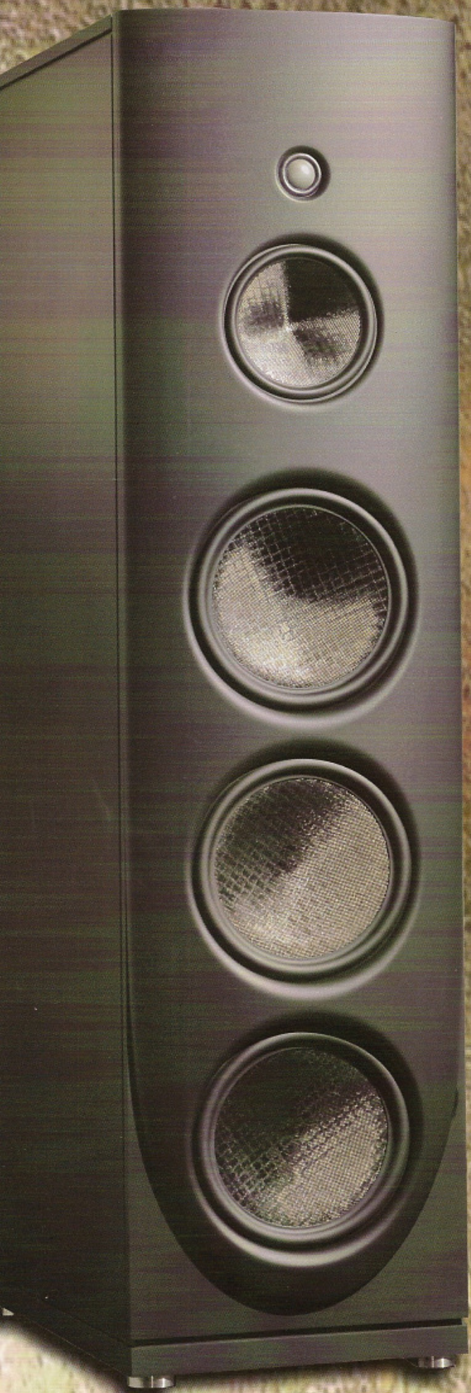
Q5浑身碳黑的箱体方方正正，造型、体积和V3区别不大。