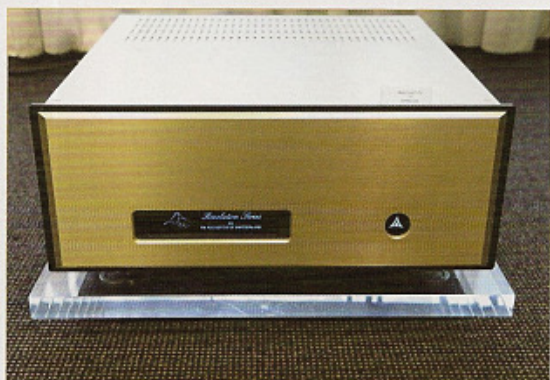
现场所搭配的FM顶级器材